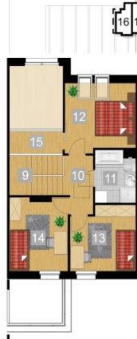
RZUT PIĘTRA 1:100