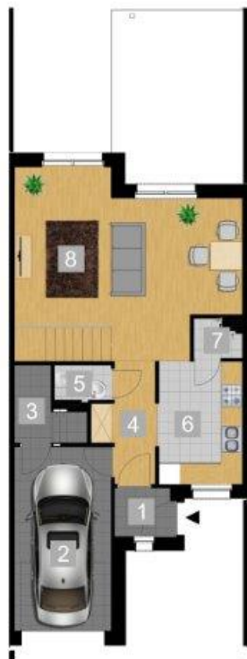
RZUT PARTERU 1:100