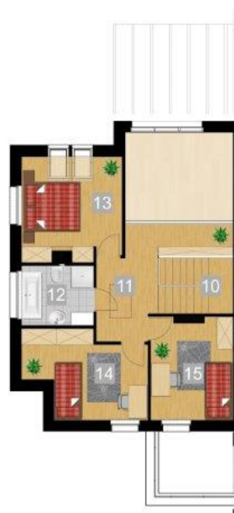
RZUT PIĘTRA 1:100