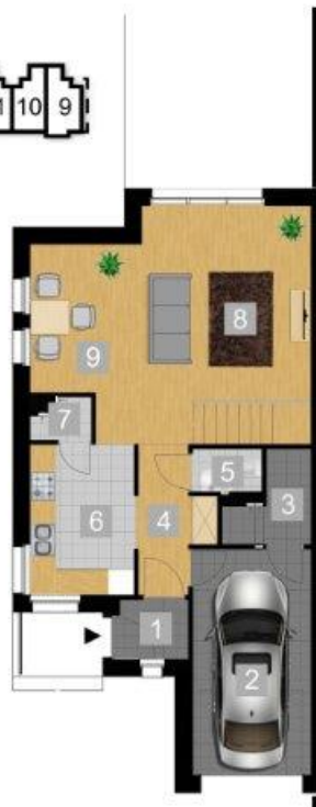
RZUT PARTERU 1:100