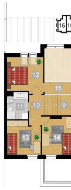
RZUT PIĘTRA 1:100