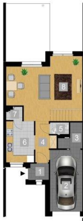
RZUT PARTERU 1:100