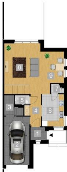
RZUT PARTERU 1:100