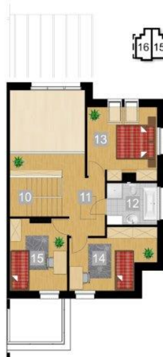
RZUT PIĘTRA 1:100